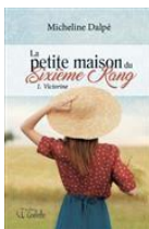
La petite maison du sixième rang. 1, Victorine / Micheline Dalpé / D1494pmd v.1

Les survivants / Ingar Johnsrud / J719sur (d)