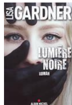
Lumière noire / Lisa Gardner / G2276Lun

Affaires privées / Marie Laberge / L117afp