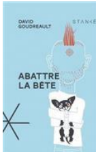
Abattre la bête / David Boudreault / G688abb

Affaires privées / Marie Laberge / L117afp